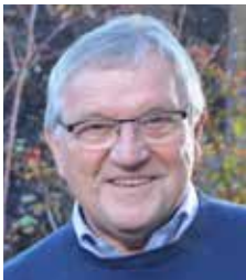
Werner Weller Beratung Hausnotruf

Ein Kontakt erfolgt über die Diakonie-Stationen.